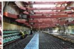
梅田の繁華側の真ん中にある広大な空き地うめきた。JR東海道支線の地下化に向けた工事が着々と進んでいます。