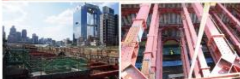
地上から見た地下化工事の様子。写真中央に小さく作業員の姿が見えます。非常に深くまで掘削工事が行われています。

大淀と梅田をつなぐ 地下道の切替工事 大淀スカイビル前から梅田グランフロント前まで地下道の移設工事が始まります。これまで地上に貨物列車が通過するJR東海道支線が走っていたために、梅田に向かう通行用の道路として地下道が設置されていました。今回のうめきた2期開発工事に伴い、スカイビル前を通るJR東海道支線が撤去され、将来的に地上でつながる大きな道路が敷設される方針となりました。 平成29年12月上旬頃に、地上に仮設の歩行者用道路を設置し、地下道を切り替えることになっています。